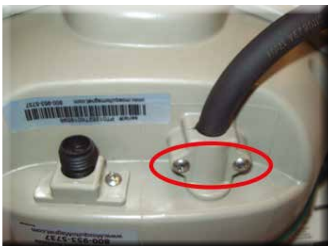
4. FJERN DE TO SKRUENE SOM HOLDER KLEMMEN RUNDT GASSKABELEN, OG FJERN SÅLEDES KLEMMEN.