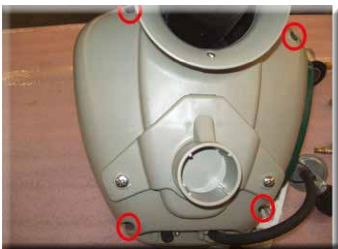
3. FJERN STRØMFORSYNINGEN NEDERST TIL VENSTRE PÅ BILDET, OG LEGG ENHETEN OPPNED PÅ ET FAST UNDERLAG. FJERN SÅ DE 4 SKRUENE MERKET MED RØDT PÅ BILDET SOM HOLDER DEKSELET PÅ Plass.