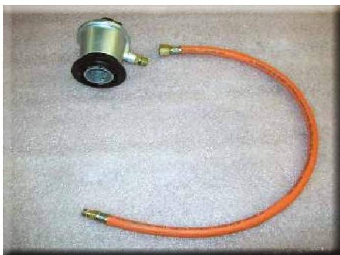
1. INNSPISER SLANGEN MM490086 OG TILHØRENDE REGULATOR

Slik skifter du påtrykksventil og slange på din Mosquito Magnet myggmaskin.