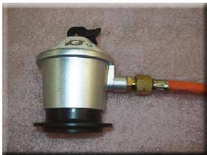
2. FEST SLANGEN TIL REGULATOREN